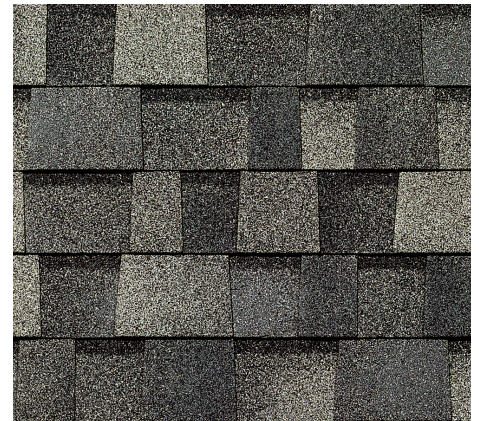
Estate Gray 1