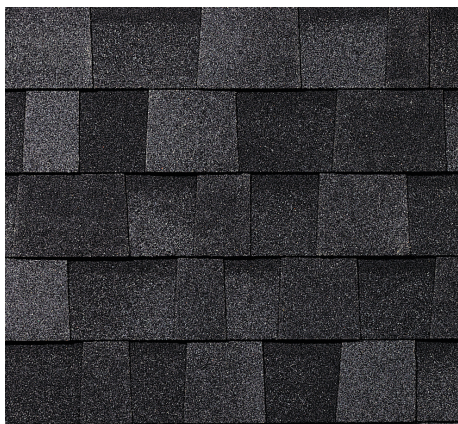
Onyx Black 1